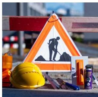
Outillage et signalisation